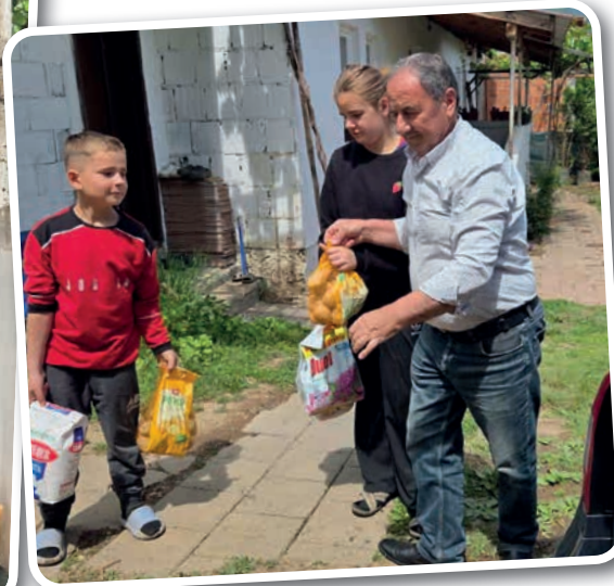
Beim Ausladen der Lebensmittel