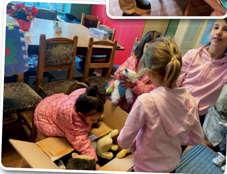
Kinder der Kindertafel erhalten kleine Geschenke

für Schulmaterial sorgen und, wo nötig, Kleidung für Kinder. An dieser Stelle einen großen Dank an alle, die uns gebrauchte Kleidung schicken, die wir besonders hier verteilen können. Kinder freuen sich über die Kleidung, die sie nun in der Schule tragen können. In diesen Tagen wird wieder ein Transport fertiggestellt werden, der nach Rumänien fährt. Aber auch für die Zukunft werden weiter Sachen gebraucht: gut erhaltene gewaschene Kleidung, neuwertiges Geschirr, gut verpackt und weitere Haushaltsgegenstände (Töpfe usw.), Spielzeug. Wenn möglich, bitte in Kartons packen. Vielen Dank!